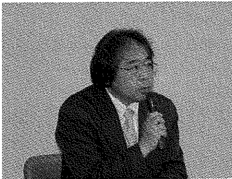
寺 辺 支 部 長（津）