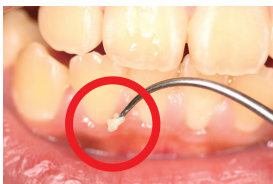
白い塊が歯垢で、この中にミュータンス菌がいます。

「ミュータンス菌」はネバネバした物質をつくりながら数を増やし、歯にくっつく歯垢（プラーク）になります。うがいだけでは取れないので、しっかり歯みがきをしましょう。