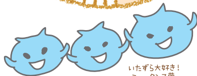
いたずら大好き！ ミュータンス菌