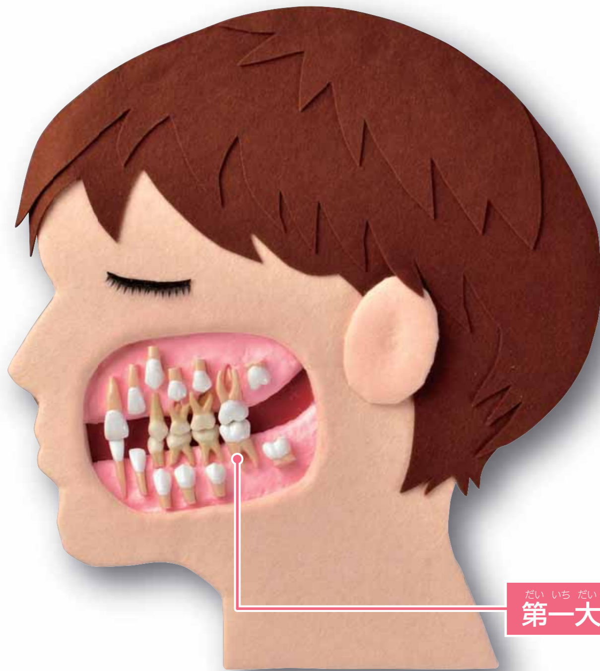
だい いち だい きゅう し 第一大臼歯